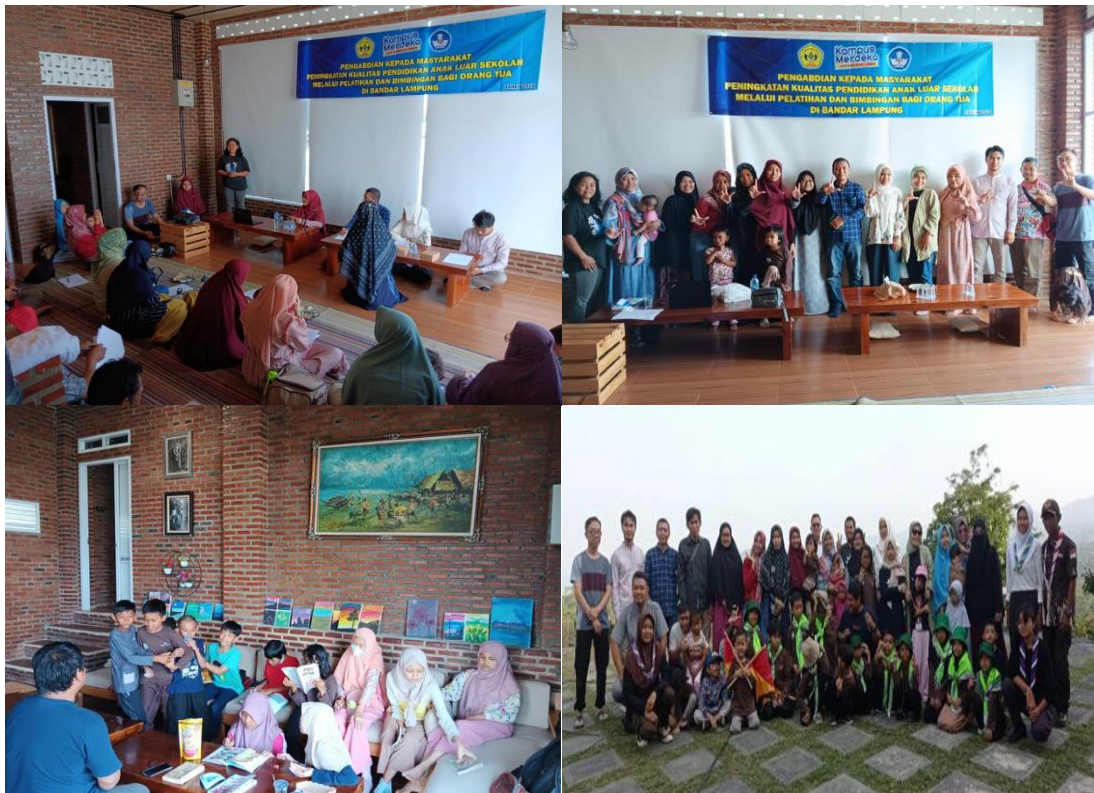
Gambar 2. Contoh Gambar

Pelaksanaan kegiatan ini menemui tantangan utama, yaitu keterbatasan akses internet di beberapa wilayah yang menghambat penerapan pembelajaran online. Selain itu, sebagian orang tua mungkin menghadapi kesulitan dalam menggabungkan pendidikan homeschooling dengan jadwal kerja atau tanggung jawab lainnya. Dengan terus mempertimbangkan dan mengatasi tantangan ini, serta mengidentifikasi peluang pengembangan, program pelatihan dan bimbingan ini memiliki potensi besar untuk terus memberikan dampak positif yang berkelanjutan dalam meningkatkan kualitas pendidikan anak luar sekolah melalui homeschooling di Bandar Lampung.