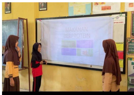
Gambar 2. Quiz Fun Game makanan gizi seimbang

Dalam gambar 2 pada hari Sabtu tanggal 19 Oktober 2024, menjelaskan tentang kegiatan yang dilakukan oleh Tim pelaksana pada pertemuan kedua. Yaitu menampilkan video pembelajaran mengenai edukasi Gizi Seimbang serta menjelaskan komponen yang ada dalam Isi Piringku. Selanjutnya untuk mengasah ingatan para siswa, kami Tim Pelaksana membuat Quiz Fun Game menggunakan media PC dan proyektor. Kegiatan tersebut bertujuan untuk mengukur kemampuan ingatan dan melatih jiwa kompetitif para siswa.