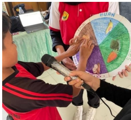
Gambar 5. Pemantapan materi dengan contoh alat pengaplikasian “Isi Piringku”

Kegiatan ke-4 pada hari Sabtu tanggal 2 November 2024, mendeskripsikan kegiatan yang dilakukan Tim pelaksana pada pertemuan keempat. Kegiatan yang dilakukan oleh Tim pelaksana yaitu mengusung konsep Mastery atau penguasaan materi dengan mengenal lebih jauh terkait materi Isi Piringku. Dengan menggunakan metode pengenalan materi, Concentration Session (berkonsentrasi dengan materi yang disampaikan), dan Focus Group Discussion (diskusi mengenai materi lebih lanjut).