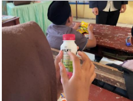
Gambar 3. Mengecek tabel fakta nutrisi pada bungkus makanan ringan

Dalam gambar 3, pada hari Sabtu tanggal 26 Oktober 2024, merupakan pertemuan ketiga Tim pelaksana dengan siswa. Pada pertemuan tersebut Tim pelaksana mengambil konsep Sharpen Learning (mempertajam ingatan) para siswa. Dengan melakukan metode Read Food Labels atau mengecek tabel Fakta Nutrisi yang terdapat pada bungkus makanan ringan, yang melibatkan para siswa untuk membawa makanan ringan yang biasa mereka konsumsi. Tujuan dari kegiatan tersebut adalah untuk mengetahui jumlah kandungan dalam makanan yang sering mereka konsumsi.