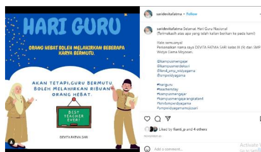
Gambar 7. Postingan salah satu siswa di Instagram