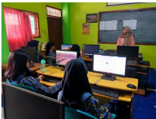
Gambar 4. Kegiatan Pembelajaran Adaptasi Teknologi – Pengoperasian Microsoft Word

Peserta didik diberikan kesempatan untuk belajar cara mengoperasikan aplikasi Google Maps seperti jarak dan waktu yang dibutuhkan, mencari suatu tempat yang akan dituju, mencari tempat tinggal mereka masing-masing, dan lainnya. Begitu juga dengan aplikasi Quizizz yang bermanfaat dalam pembelajaran agar siswa tidak merasa bosan.