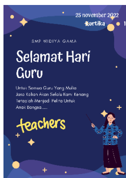
Gambar 6. Poster salah satu siswa

Dari kegiatan yang telah dilaksanakan kepada sasaran yaitu peserta didik SMP Widya Gama Mojosari. Salah satu hasil kegiatan pembelajaran yaitu poster hari Guru yang diunggah di media sosial masing-masing.