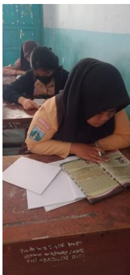
Gambar 2. Kegiatan Pembelajaran Literasi