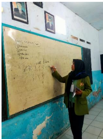
Gambar 3. Kegiatan Pembelajaran Numerasi