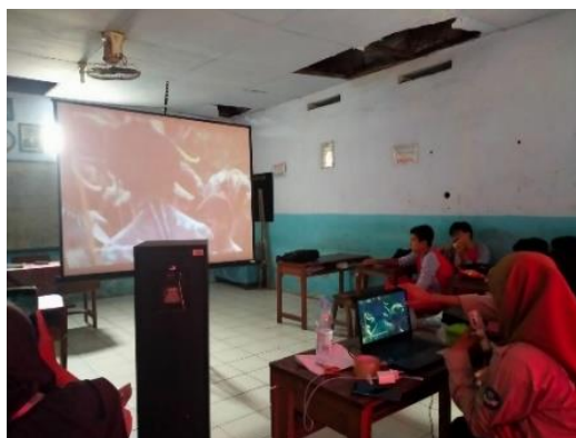
Gambar 5. Kegiatan Pembelajaran Literasi melalui Film