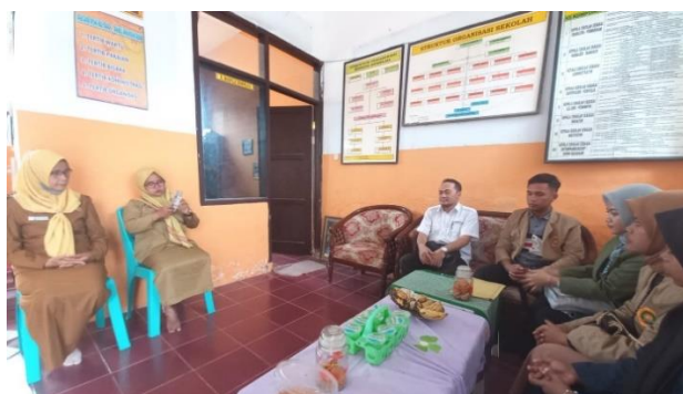
Gambar 3. Observasi Awal di SDN Karang Nangkah 1

Dalam mengatasi permasalahan yang telah dijelaskan, pelaksanaan program kampus mengajar angkatan 4 yang disasarkan di SDN Karang Nangkah 1 terdiri dari beberapa mahasiswa yang berlatar belakang berbeda seperti Universitas Pembangunan Nasional Veteran Jawa Timur, Universitas Madura, dan STKIP PGRI Bangkalan. Berdasarkan program kerja yang telah disusun