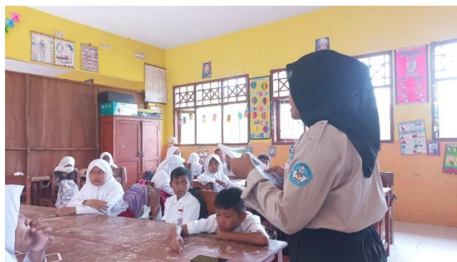
Gambar 5. One Day One Book

book, keinginan membaca sebuah cerita menjadi meningkat serta siswa sering melakukan peminjaman buku di perpustakaan.