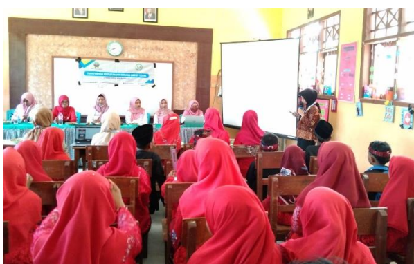
Gambar 6. Sosialisasi Gerakan Literasi Membaca

Sosialisasi literasi membaca merupakan rencana program mahasiswa kampus mengajar dalam mengajak dinas perpustakaan dan kearsipan Bangkalan untuk kolaborasi dalam meningkatkan budaya kegemaran membaca anak dan memahami perubahan budaya digital sesuai perkembangan waktu. Melihat kondisi literasi yang lemah pada siswa di SDN Karang Nangkah 1, program ini mengajak untuk membudayakan gerakan literasi sebagai hal penting dalam mewujudkan negara yang unggul. Menurut Teguh (2020) Gerakan Literasi Sekolah adalah usaha atau kegiatan partisipatif yang melibatkan warga sekolah (siswa, guru, kepala sekolah, staf pengajar, regulator sekolah, komite sekolah, orang tua/wali siswa), peneliti, penerbit, media, masyarakat (tokoh masyarakat yang mewakili keteladanan, dunia usaha dan Pemangku Kepentingan) yang dikoordinir oleh Direktorat Jenderal Pendidikan Dasar dan Menengah Kementerian Pendidikan dan Kebudayaan [9]. Melalui program sosialisasi literasi, siswa dapat mengenal program dari Dispusip Bangkalan yang dibentuk dalam “Kubiling” yakni membaca ataupun meminjamkan buku yang telah disediakan di mobil perpustakaan. Hasil dari program ini membuat siswa termotivasi untuk menggiatkan kegemaran membaca melalui fasilitas perpustakaan yang ada di sekolah serta siswa menginginkan melakukan kunjungan ke perpustakaan kota Bangkalan.