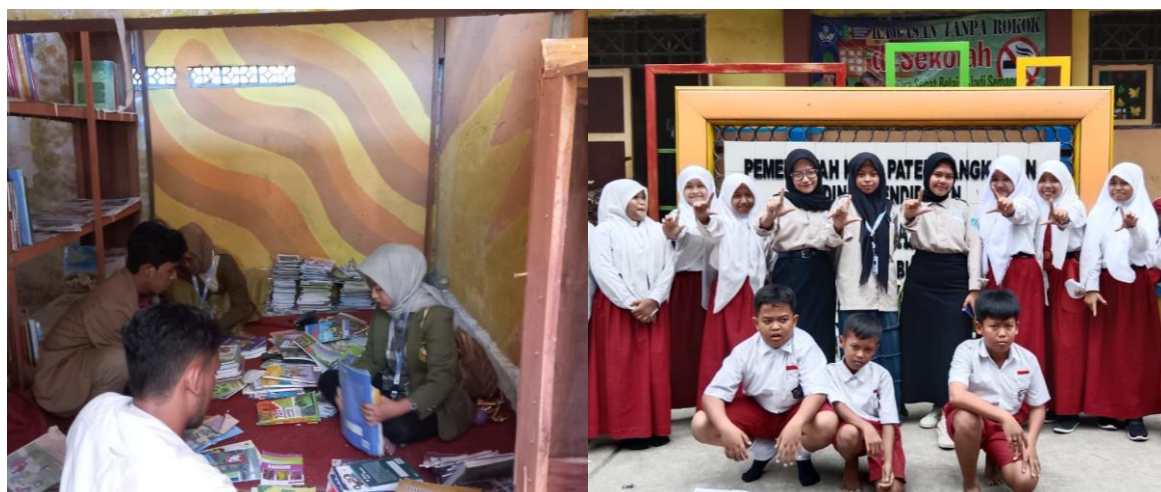
Gambar 9. Pengelolaan Perpustakaan