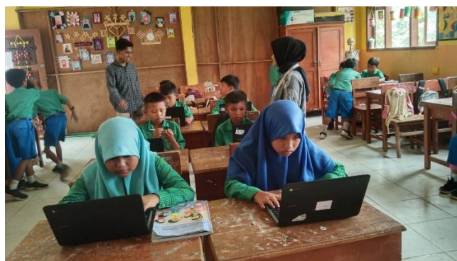
Gambar 8. Pelaksanaan AKM Kelas