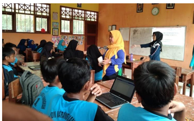
Gambar 7. Pelatihan IT

Adaptasi teknologi juga dapat dilihat dalam pelaksanaan AKM Kelas. Tujuan pelaksanaan AKM Kelas merupakan langkah dalam mengukur AN yang meliputi instrumen kognitif nasional AKM, kajian karakter dan kajian lingkungan belajar dengan sumber data penilaian yang mewakili siswa, seluruh guru dan kepala unit [10]. Dengan adanya hal tersebut, Penggunaan chromebook merupakan hal awam bagi siswa di kelas 5. Sehingga memunculkan ide agar dapat memanfaatkan 15 unit chromebook yang bisa dioperasikan pada pelaksanaan pretest dan postest. Selanjutnya, mahasiswa memberikan pemahaman dan ilmu teknologi terhadap guru yang ingin menerapkan ms.word dan video pembelajaran melalui implementasi kurikulum merdeka.