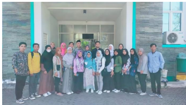
Gambar 2. Kunjungan di Dinas Pendidikan Kabupaten Bangkalan

Program Kampus Mengajar Angkatan 4 membekali mahasiswa dengan berbagai materi pengetahuan dan keterampilan yang bermanfaat pada masa penugasan dalam membantu sasaran sekolah penempatan. Mahasiswa akan dibantu dalam membantu menghadapi persoalan proses pembelajaran yang berkaitan dengan guru maupun siswa, membantu adaptasi teknologi, dan membantu administrasi. Pembekalan dilakukan pada tanggal 12 Juli 2022 – 27 Juli 2022 melalui media platform youtube, zoom semua informasi terdapat pada grup telegram yang terhubung dengan panitia pusat dari kemendikbudristek dalam menyampaikan informasi penting seputar kampus mengajar angkatan 4. Setelah melewati masa pembekalan, mahasiswa mendatangi dinas pendidikan kabupaten Bangkalan pada 29 Juli 2022, guna mendapatkan pengarahan dan pelepasan dosen pembimbing lapangan serta mahasiswa kampus mengajar angkatan 4 dengan memberikan surat tugas pada sekolah sasaran. Pada tanggal 1 Agustus 2022 sampai 6 Agustus 2022, mahasiswa melakukan observasi awal melalui pengamatan secara langsung serta wawancara (kepala sekolah, guru kelas 1-6, dan beberapa siswa) untuk mengetahui permasalahan pada kondisi nyata. Kegiatan observasi yang dilakukan meliputi lingkungan fisik sekolah, aktivitas-aktivitas di sekolah, proses pembelajaran yang mencakup literasi dan numerasi, adaptasi teknologi, dan administrasi sekolah.