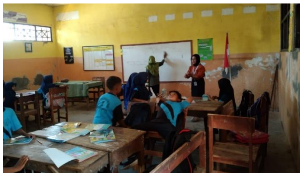
Gambar 4. Kegiatan Belajar Mengajar

Dalam meningkatkan literasi pada siswa, mahasiswa membentuk program pengelolaan perpustakaan yang berguna untuk melanjutkan budaya kegemaran membaca pada siswa melalui program one day one book. Gerakan membaca selama 15 menit dengan sasaran kelas 1 sampai kelas 6 dilakukan dengan cara 1. Menunjukkan sampul buku, 2. Mengajukan pertanyaan seperti (apa judul buku yang dibawa?, gambar apa yang terdapat dalam sampul buku?, setelah melihat sampul buku, kira-kira bagaimanakah cerita di dalam buku ini?), 3. Membacakan judul buku dan nama penulis buku, 4. Membaca dengan nyaring serta menunjukkan gambar ilustrasi yang tertera pada buku, 5. Menunjuk siswa untuk melakukan resensi bacaan serta menanyakan kejadian dalam cerita. Untuk mengetahui pemahaman siswa dalam mendengarkan cerita, mahasiswa menunjuk siswa untuk melakukan resensi bacaan serta menanyakan kejadian dalam cerita. Dari program one day one