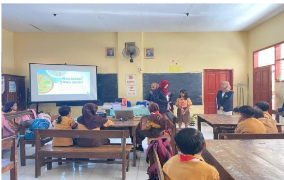
Gambar 2. Penyajian Materi Pola Hidup Sehat Oleh Tim Pelaksana Kepada Murid Kelas 4 SDN Pancoran 3.

Pada kegiatan pemahaman materi tentang pola hidup sehat kepada siswa kelas 4, sebanyak 14 siswa mengikuti dengan antusias. Siswa mampu menyebutkan lima kebiasaan hidup sehat, seperti makan bergizi, mencuci tangan, dan berolahraga. Sebanyak 80% siswa memahami pentingnya minum air putih minimal 8 gelas sehari, dan sesi tanya jawab berlangsung aktif dengan 8 pertanyaan diajukan oleh siswa. Kegiatan ini berjalan lancar karena materi disampaikan melalui presentasi dengan gambar interaktif dan cerita singkat, sehingga mudah dipahami. Tantangan yang muncul adalah beberapa siswa yang cenderung pasif, sehingga fasilitator perlu memberikan dorongan melalui kuis singkat untuk meningkatkan partisipasi.