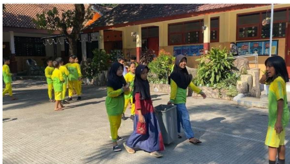
Gambar 4. Kegiatan membersihkan halaman sekolah dan ruang kelas

kebersihan, tetapi juga menumbuhkan semangat kerja sama di antara siswa. Senam pagi dan kegiatan bersih-bersih ini berhasil meningkatkan semangat siswa sebelum memulai aktivitas belajar. Gerakan yang sederhana dan berulang membantu siswa yang baru pertama kali mengikuti senam, meskipun beberapa siswa yang kurang fokus perlu bimbingan langsung dari fasilitator untuk tetap terlibat.