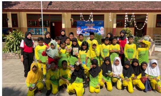
Gambar 5. Dokumentasi bersama dengan seluruh murid kelas 4 dan kelas 5 pada hari terakhir kegiatan

Kegiatan jalan sehat juga berlangsung sukses dengan partisipasi 35 siswa yang menempuh rute sepanjang 2 km dalam waktu rata-rata 30 menit, dengan jeda istirahat singkat di tengah perjalanan. Setelah kegiatan, siswa mengisi survei mengenai pemahaman pola hidup sehat, yang menunjukkan bahwa 75% siswa merasa lebih paham pentingnya menjaga pola makan, membedakan makanan yang sehat dan tidak sehat, cara cuci tangan yang benar menggunakan air bersih dan harus rutin untuk melakukan aktivitas fisik. Jalan sehat ini menjadi momen interaktif yang menyenangkan sekaligus memberikan pengalaman nyata tentang manfaat pola hidup sehat. Hasil survei menunjukkan peningkatan pemahaman siswa, meskipun perlu ditambahkan sesi refleksi singkat untuk mengaitkan pengalaman dengan materi yang telah dipelajari.