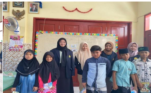
Gambar 3. Pembagian Hadiah Kepada Murid Kelas 5 Yang Sudah Menjawab Pertanyaan Dari Pemateri.

Untuk siswa kelas 5, kegiatan serupa dilakukan dengan pendekatan yang lebih mendalam. Sebanyak 21 siswa mengikuti kegiatan ini dan mampu mengidentifikasi kebiasaan buruk yang dapat merusak pola hidup sehat, seperti begadang dan makan makanan instan berlebihan. Sebanyak 85% siswa dapat menjelaskan pentingnya olahraga minimal 30 menit sehari. Mereka juga menjawab pertanyaan yang diberikan mengenai makanan sehat dan tidak sehat dengan rata-rata skor pemahaman mencapai 90%. Penyampaian materi dilakukan melalui media bergambar, yang berhasil meningkatkan pemahaman siswa. Namun, ada beberapa siswa yang memerlukan penjelasan lebih rinci mengenai dampak jangka panjang dari kebiasaan buruk.