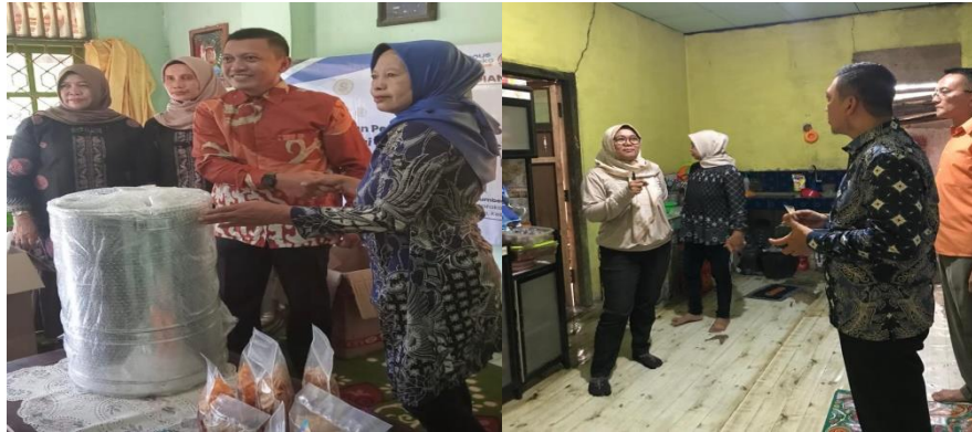
Gambar 2. Dokumentasi Kegiatan Pengabdian