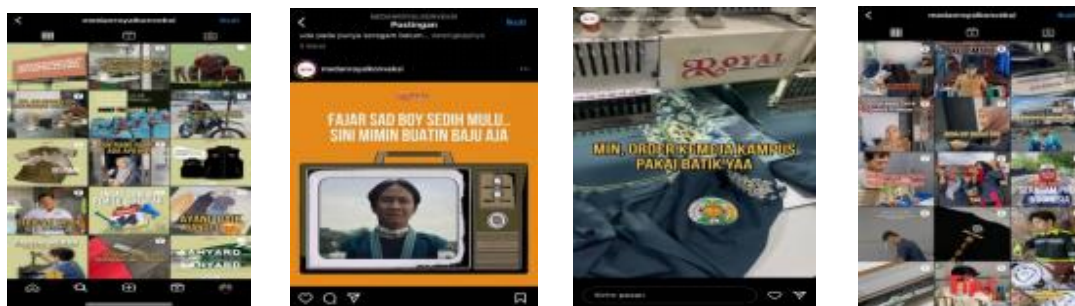
Gambar 3. Penyajian konten Royal Konveksi & Production