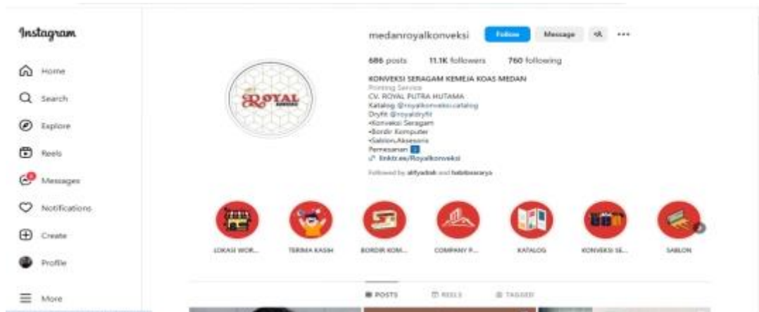
Gambar 2. Profil Instagram @medanroyalkonveksi