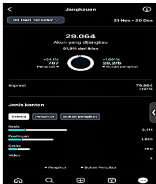
Gambar 1. Insight Instagram Royal Konveksi & Production

Semua konten yang di unggah di @medanroyalkovenski adalah kegiatan komunikasi pemasaran yang dilakukan oleh perusahaan untuk terus memberikan informasi kepada pelanggan dan pengikut tentang produk perusahaan. Royal Konveksi & Production (CV. Royal Putra Utama) telah mengimplementasikan berbagai strategi komunikasi pemasaran yang terukur dan terencana dengan cermat. Berdasarkan wawancara dan analisis, adapun strategi komunikasi pemasaran yang dilakukan oleh Royal Konveksi & Production (CV. Royal Putra Utama).