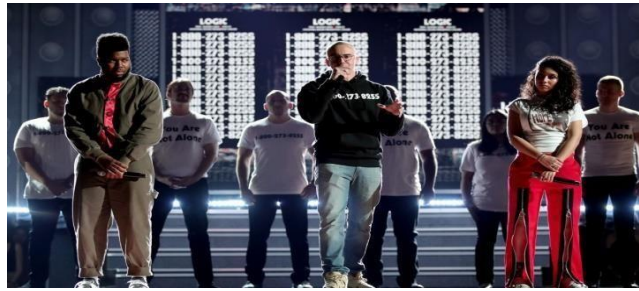
Gambar 2. Penampilan Artis Logic, Khalid dan Alissa Cara di 60 Tahun Grammy Awards 2018

Nomor 1-800-273-8255 adalah nomor yang dapat dihubungi orang jika mereka mengalami masalah dan ingin berbicara dengan seseorang. Ini adalah upaya untuk mencegah orang ingin bunuh diri. Lagu yang ditulis dan direkam oleh Logic ini sangat efektif membantu orang-orang yang sedang mengalami krisis. Studi tersebut menemukan bahwa ketika lagu tersebut digunakan dalam kampanye pencegahan, hal itu dapat membantu mengurangi jumlah kasus bunuh diri. Namun penurunan tersebut relatif kecil. Artinya, lagu tersebut mungkin tidak memiliki efek berbahaya pada orang yang menyebutnya, yang dapat menyebabkan peningkatan kasus bunuh diri.