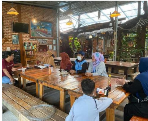
Gambar 4. Rapat Pokdarwis

Dari kutipan diatas, indikator dialogis dari komunikasi partisipatif tercipta pada saat rapat internal dengan mewajibkan setiap divisi untuk mengajukan program kerja yang kemudian dirapatkan bersama.