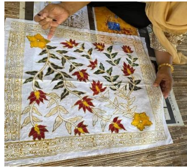
Gambar 5. Pemberdayaan masyarakat dengan pelatihan membuat