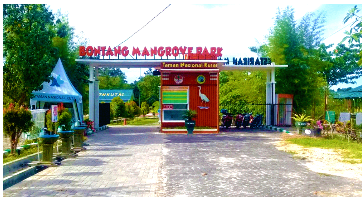
Gambar 2. BMP sebagai Mitra Pokdarwis

“Bentuk kerjasamanya dengan Pokdarwis itu peningkatan kapasitas seperti membuat, dengan harapan ada produk keluar untuk layak jual. Kami ada anggaran tiap tahun untuk dialokasikan ke Pokdarwis termasuk recycle sampah dan lain-lain,” (Wawancara 1 Maret 2023).