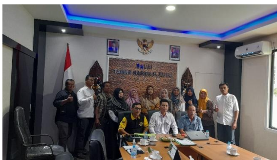
Gambar 6. Rapat bersama TNK

“Pertama, lewat pertemuan ke seluruh RT, ada 28 RT. Terus lewat Whatsapp grup kelurahan kami gencarkan terus, habis itu tindakan. Pertemuannya dengan warga memang tidak menyeluruh, tapi terkhusus. Misal untuk kelompok nelayan, kami pinjam Gedung Perikanan, kerjasama untuk penyuluhan dampak wisata terhadap Tanjung Limau.” (Wawancara, 28 Februari 2023).