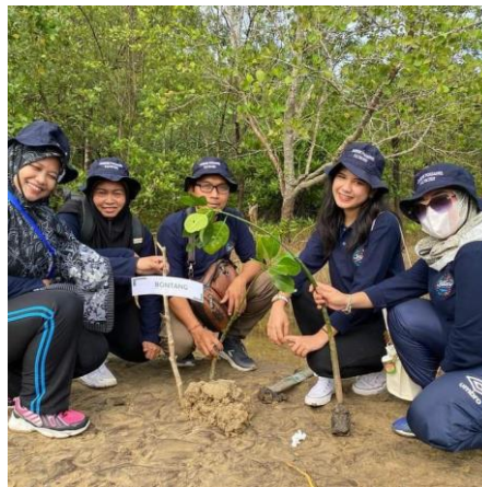
Gambar 3. Anggota Pokdarwis Saat Penanam Mangrove

Hal yang Sama ditunjukkan dengan perbedaan latar belakang pendidikan dan agama, yang mana anggota pokdarwis memiliki tingkat pendidikan yang berbeda, mulai dari SD hingga Sarjana. Adapun dalam hal agama ditunjukkan dengan Ketua Pokdarwis yang beragama Hindu dan beranggotakan orang dengan agama Islam. Semua perbedaan ini tidak menghalangi proses interaksi dan komunikasi dalam internal pokdarwis yang mana hal ini menunjukkan bahwa terdapat indikator heteroglasia didalamnya.