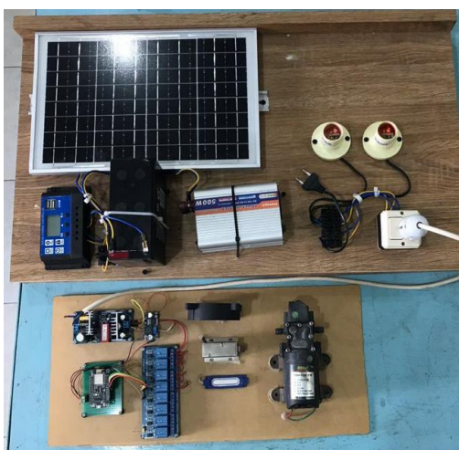
Gambar 3. Prototype Otomasi IoT dan Energi Kebaruan

Desain ini menunjukkan kemajuan signifikan dalam penerapan IoT untuk pertanian hidroponik, terutama dalam konteks pemanfaatan energi terbarukan. Penggunaan panel surya membuat sistem ini lebih ramah lingkungan dan mandiri, sehingga dapat diterapkan di daerah yang memiliki keterbatasan akses listrik.