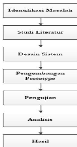
Gambar 1. Model Proses Penelitian

Secara kualitatif, observasi langsung terhadap kinerja prototipe dilakukan, serta wawancara dengan ahli pertanian untuk mendapatkan umpan balik terhadap potensi implementasi sistem. Dengan demikian, analisis ini bertujuan untuk mengevaluasi kinerja sistem secara menyeluruh dan memberikan gambaran tentang efektivitas penerapan teknologi ini dalam skala yang lebih besar. Hasil dari analisis ini digunakan untuk mengevaluasi efektivitas sistem yang dikembangkan, menyoroti keunggulan dan kekurangannya, serta memberikan rekomendasi untuk pengembangan lebih lanjut. Dengan pendekatan menyeluruh ini, penelitian diharapkan mampu menghasilkan solusi inovatif untuk pertanian hidroponik yang berkelanjutan, efisien, dan mudah diakses.